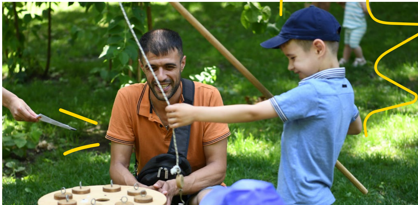
Ojciec bawi się z synem podczas wydarzenia z okazji pierwszego Międzynarodowego Dnia Zabawy

jętności życiowe nastolatków (PALS) zwiększyły świadomość specjalistów pracujących w placówkach edukacyjnych, służbach społecznych, organizacjach społecznych oraz instytucjach administracji publicznej w obwodzie donieckim. Szkolenia te pogłębiły wiedzę specjalistów na temat kluczowych zagadnień ochronnych w kontekście kryzysu humanitarnego w Ukrainie, a jednocześnie wspierały rozwój umiejętności sprzyjających wzmocnieniu odporności zawodowej. W celu wzmocnienia współpracy w obszarze ochrony dzieci w Ukrainie podejście to zostało uzupełnione o spotkania i okrągłe stoły z władzami lokalnymi. W ostatnim roku Plan International i jej partnerzy realizowali również różnorodne programy budowania potencjału, w tym szkolenia dla pracowników socjalnych z zakresu zarządzania przypadkami w kontekstach konfliktowych.