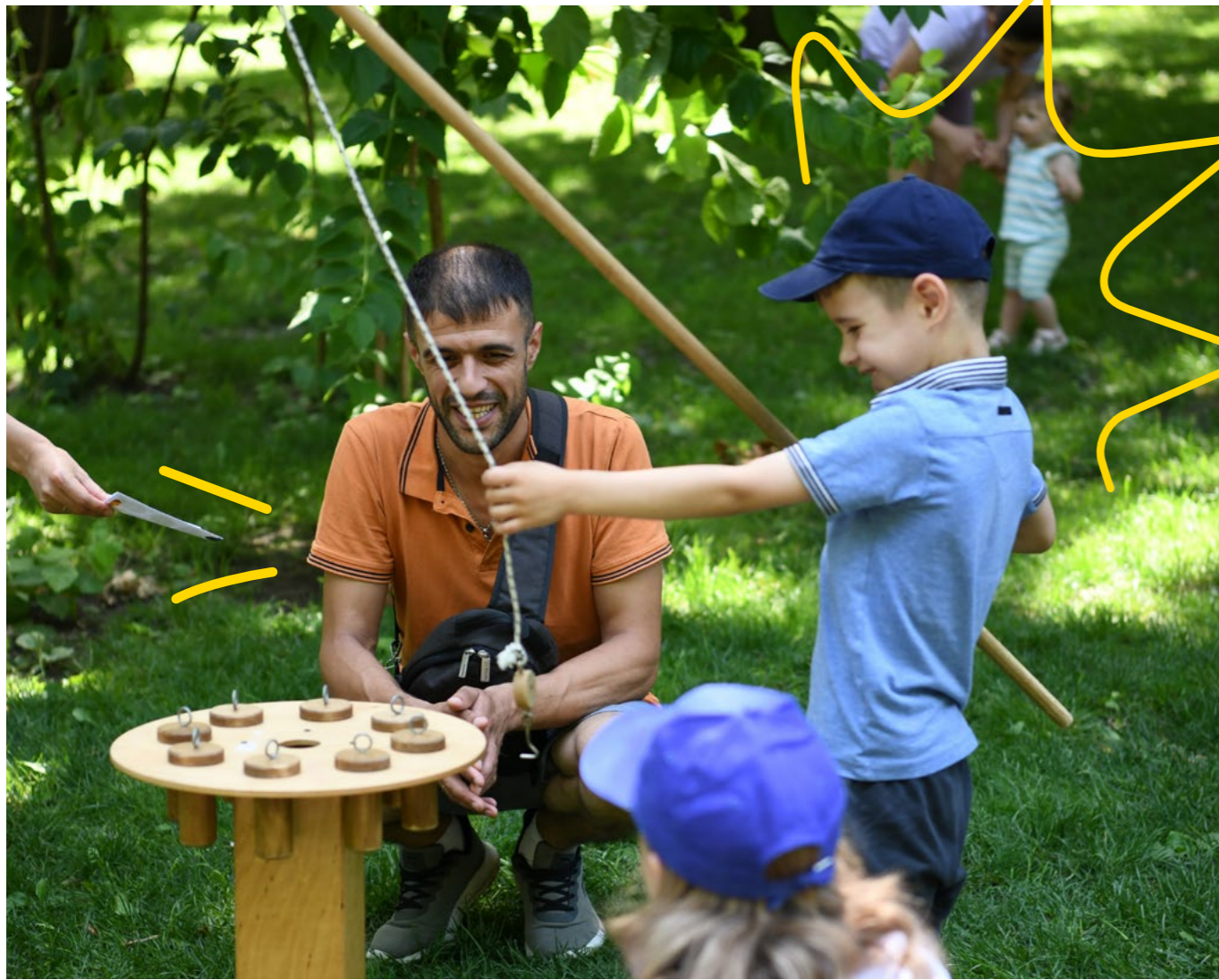
Батько грається зі своїм сином на заході з нагоди першого Міжнародного дня гри

International та партнери також провели різні програми з розбудови потенціалу, включаючи навчання соціальних працівників з питань управління випадками в умовах конфлікту.