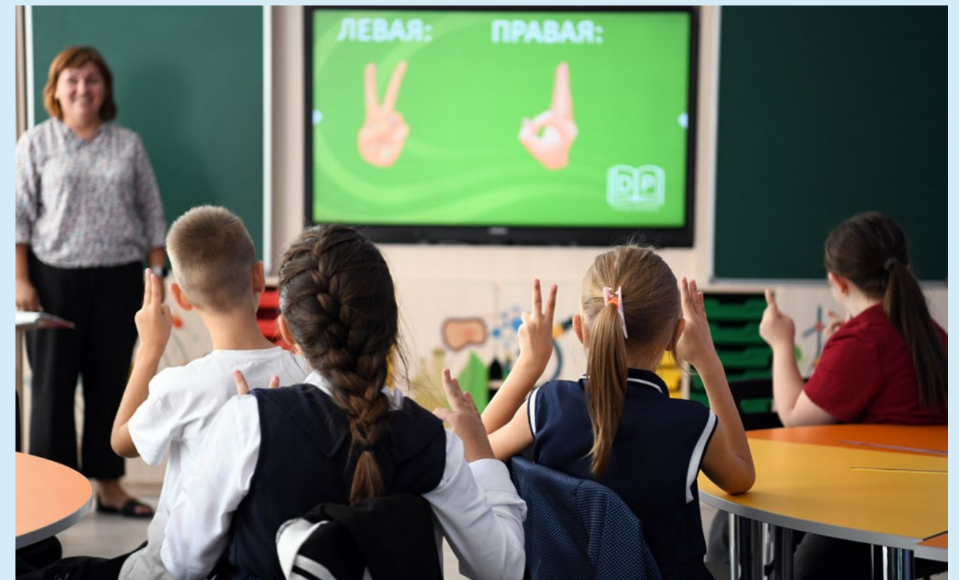
Dzieci uczą się w klasie w jednym z laboratoriów EduTech w Moldawii

Ukraińska młodzież wskazywała również na frustrację związaną z nauką online, zwracając uwagę na spa-