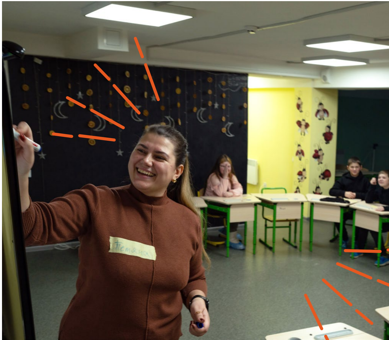
Nauczycielka prowadzi zajęcia w piwnicy przedszkola w obwodzie charkowskim

wódcze wspierały potrzeby psychospołeczne i rozwojowe uczestników, zapewniając poczucie stabilności, przynależności i możliwości ekspresji w warunkach długotrwałego przesiedlenia. Połączenie aktywności artystycznych, fizycznych i refleksyjnych przyczyniło się do dobrostanu emocjonalnego i reintegracji społecznej.