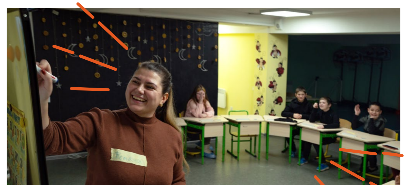
Учитель проводить урок у підвалі дитячого садка на Харківщині