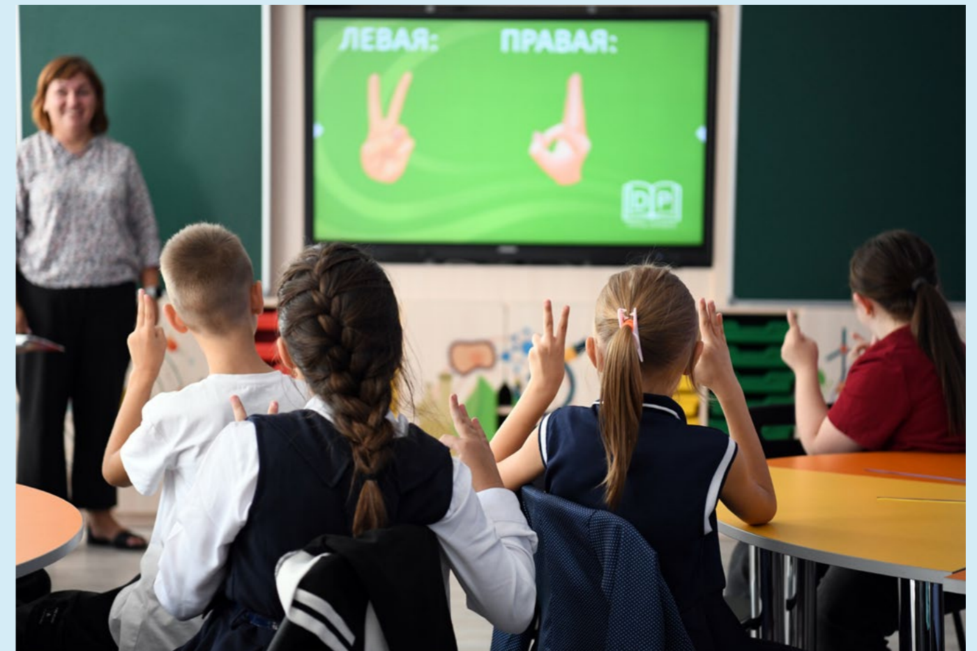
Діти навчаються на уроці в одній із лабораторій EduTech у Молдові

Українська молодь також висловила своє незадоволення онлайн-навчанням, відзначаючи зниження