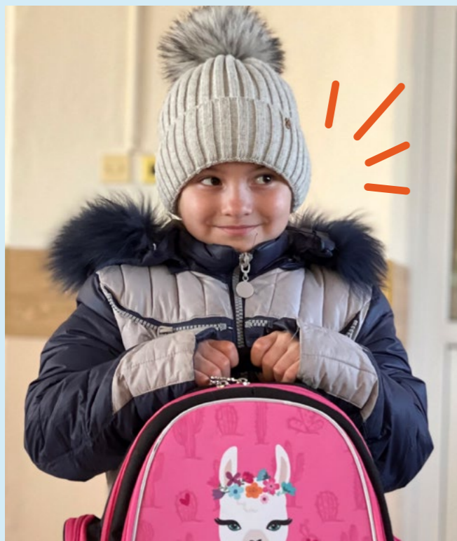
Дівчинка з новим рюкзаком, наданим партнером Plan International у Молдові

Згідно з дослідженням Plan International, в Польщі відсутність психолого-педагогічної підтримки для учнів з України була однією з найважливіших проблем, що спостерігалися на початку ескалації війни. Хоча працівники шкіл усвідомлювали потенційну травму, з якою стикаються біженці, вони визнали необхідність розвитку своїх навичок, зокрема діагностики та реагування на складні емоції, а також розпізнавання ситуацій, які загрожують емоційній безпеці учнів або вимагають спеціалізованих заходів. Окрім підготовки вчителів, асистенти з міжкультурних питань також відіграли важливу роль у забезпеченні емоційної безпеки, допомагаючи учням впоратися з культурними відмінностями, підтримуючи освітні процеси та сприяючи взаємодії з батьками.