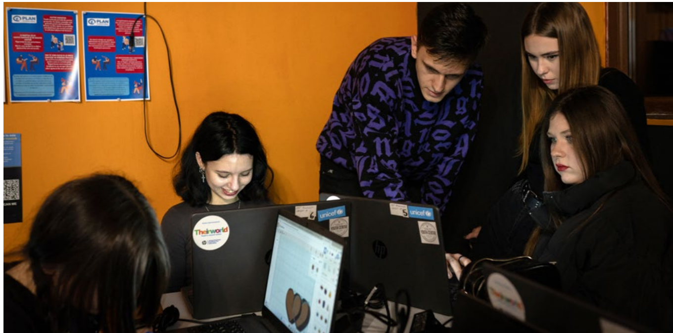
Українська молодь бере участь у занятті з робототехніки в молодіжному центрі в Бухаресті

до води, що забезпечило школи та дитячі садки в Миколаївській області доступом до питної води, а отже, покращило доступ до освіти. Крім того, відновлення шкіл у Черкаській, Хмельницькій, Кіровоградській та Вінницькій областях покращило умови навчання та залучення учнів, особливо в сільській місцевості. Значне поліпшення навчального середовища для дітей та впровадження нових освітніх інструментів і цікавих заходів підвищили їхню мотивацію та залученість. Таким чином, заходи партнерів в Україні підкреслюють важливість підтримки інфраструктури для зміцнення стійкості освітніх послуг.