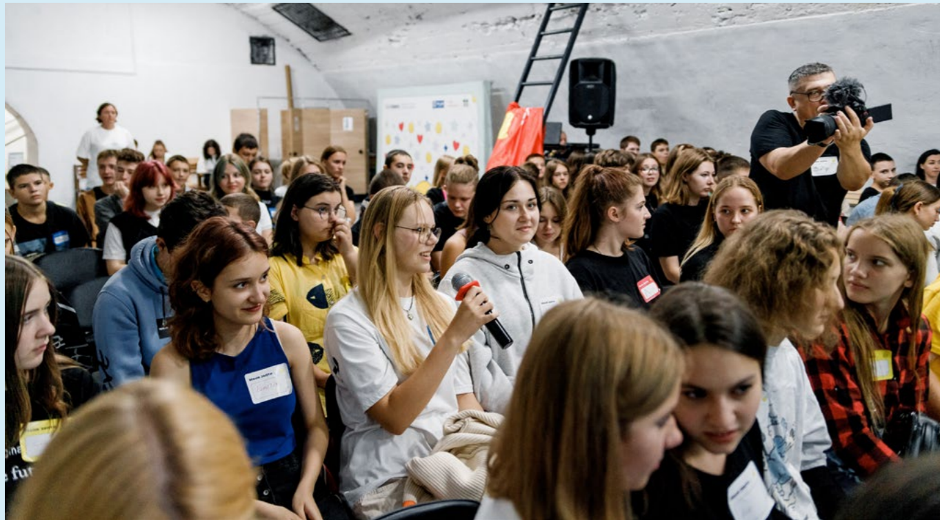
Молоді люди беруть участь у воркшопі «Safeteen» в Україні

ства та того, як вони впливають на вибір і досвід, доступні як дівчатам, так і хлопцям.