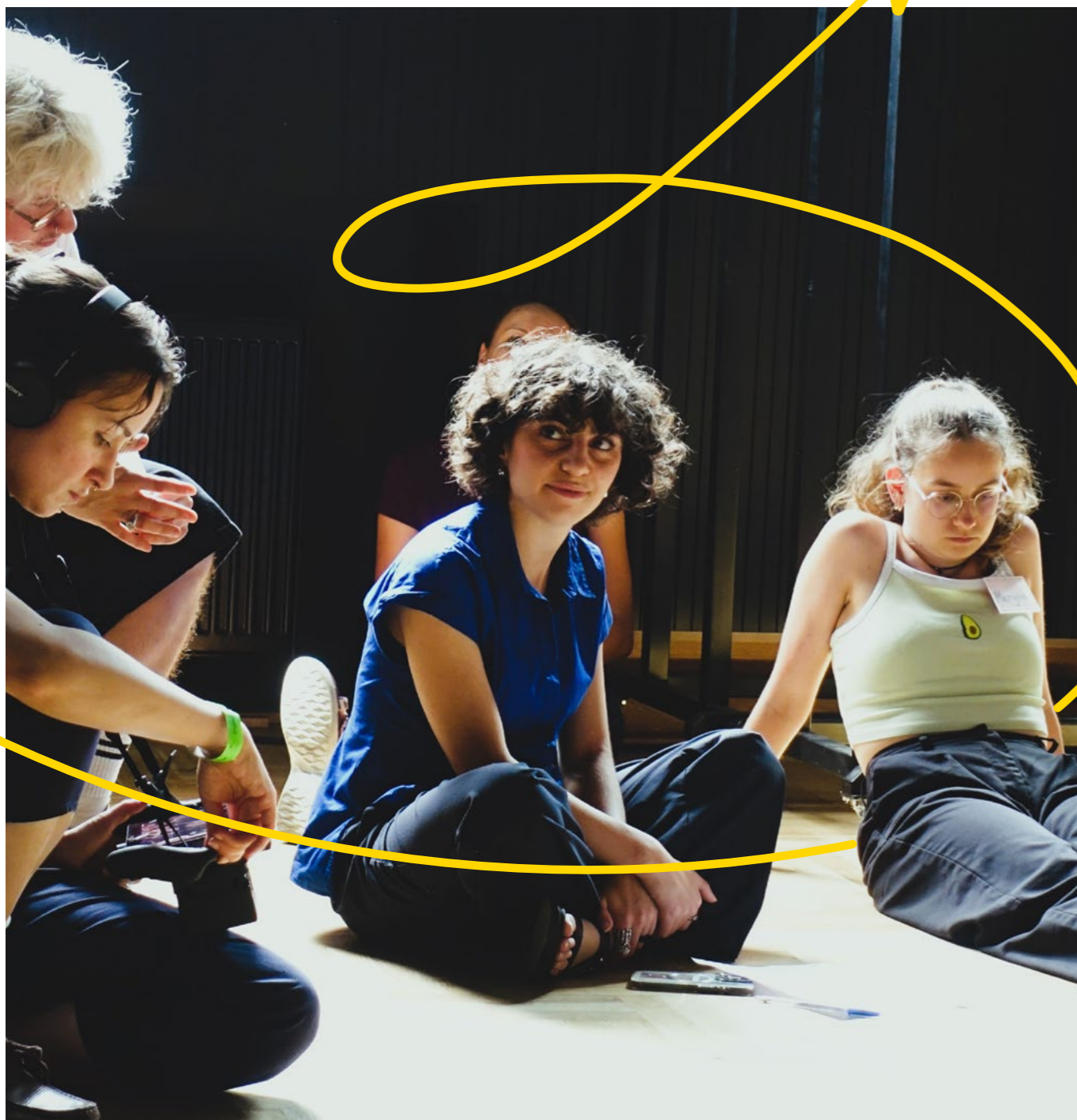
Учасники обговорюють маршрут перед початком «маршу безпеки» у Варшаві в межах проекту Plan International «Безпечні міста»

Аналогічно, в Румунії в рамках заходів також було залучено чоловіків і хлопців до інформаційних кампаній, просування позитивних рольових моделей та боротьби зі суспільними уявленнями, що сприяють насильству. У Польщі програми щодо ГЗН також перейшли від управління надзвичайними випадками та надання правової допомоги до більш широкої стратегії профілактики, з більш глибоким залученням до гендерної рівності для довгострокового зменшення ГЗН. Таким чином, ці ініціативи в Україні, Польщі та Румунії відповідають регіональним цілям щодо усунення першопричин та зміцнення стійкості громади до ГЗН.